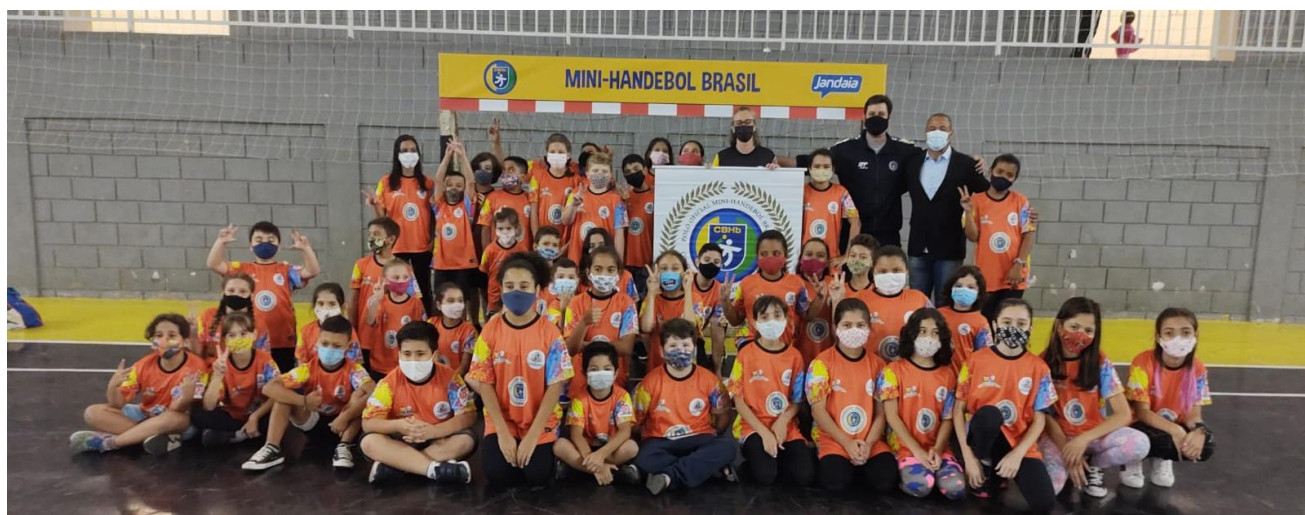
Foto 30: Inauguração oficial do polo Prefeitura Municipal de Votorantim.