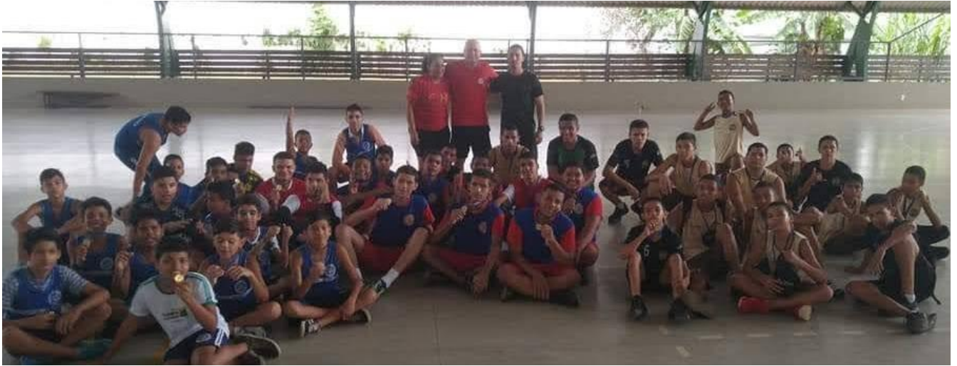
Foto 1: Mini-Handebol e Handebol da Escola Diogo Feijó, polo oficial.