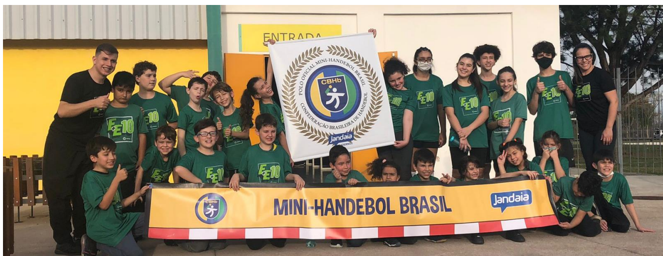
Foto 34: Mini-Handebol do Centro de Esporte e Lazer Avelino Vieira – Polo Oficial.