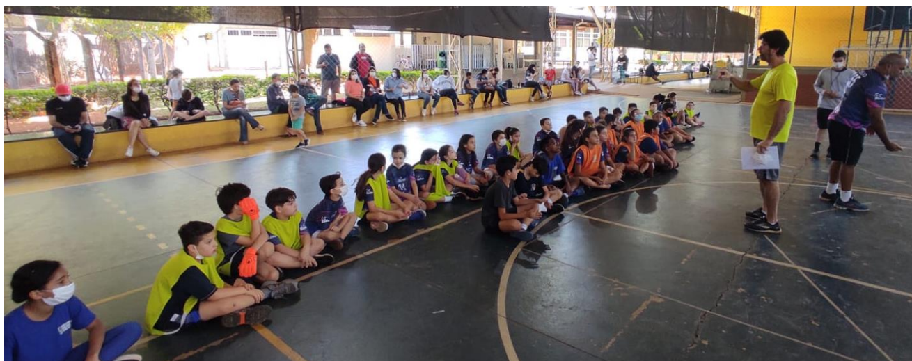
Foto 22: Festival de Mini-Handebol na Escola de Educação Básica (ESEBA/UFU).